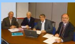
Le bureau G2Et