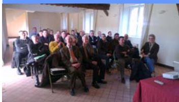
Assemblée Générale 2013