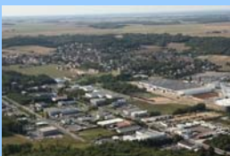
Le Bassin Etampois

Vous avez un article à nous soumettre ? Vous voulez nous faire découvrir l'univers de votre entreprise ? N'hésitez pas à nous envoyer vos suggestions !