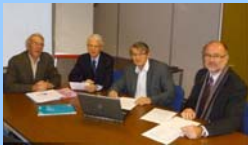
Le bureau G2Et